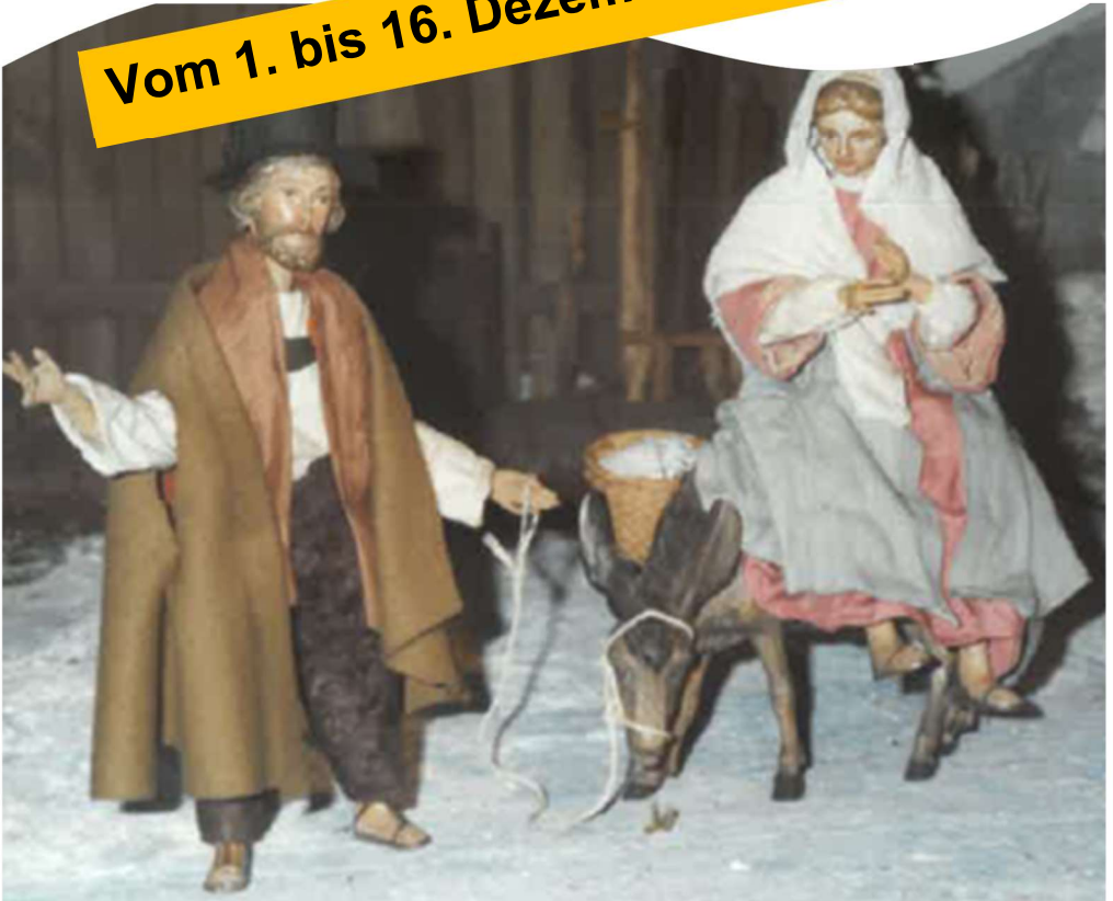
Krippendarstellung in der Taufkapelle Prien