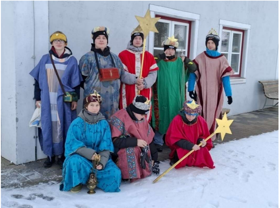
Sternsinger Antwort

Vergelt's Gott allen Spendern, allen Kindern und Jugendlichen, die unermüdlich unterwegs waren, um anderen Kindern zu helfen sowie auch allen Betreuern.