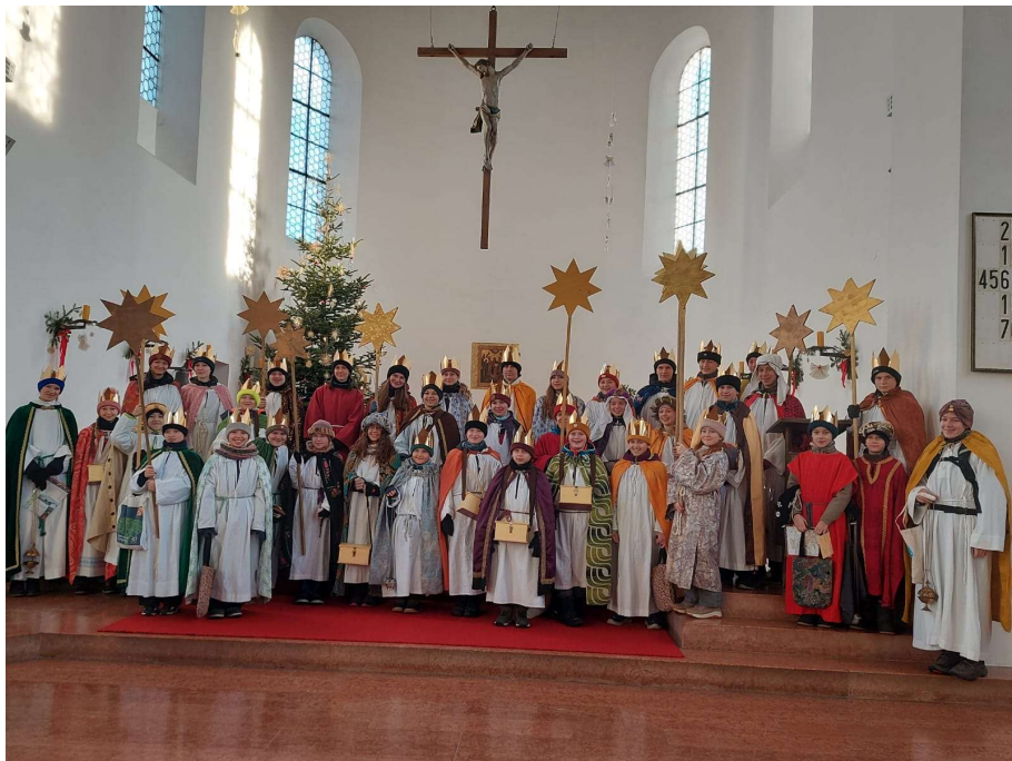
Stersinger Bad Endorf

Die Kreistänze im Februar sind am Donnerstag, 6. bzw. 20. Februar jeweils von 9.30 – 11 Uhr im Pfarrheim Bad Endorf.